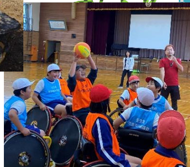
▲車いすバスケットボール