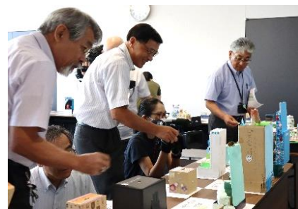
▲昨年の審査会の様子